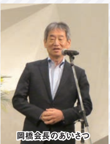
岡橋会長のあいさつ