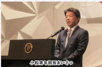
小松青年部長あいさつ