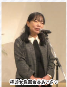
権頭女性部会長あいさつ